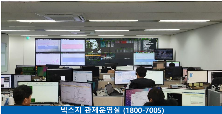
넥스지 관제운영실 (1800-7005)