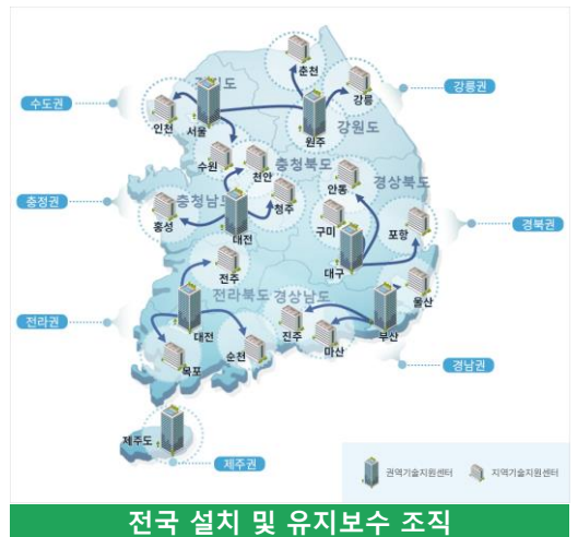
전국 설치 및 유지보수 조직